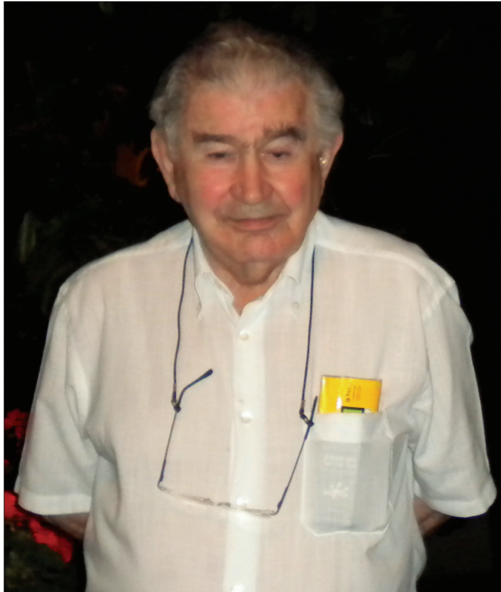
Antonio Gamoneda.

poétiques possibles dans son œuvre, en particulier françaises. Il évoque également sa conception de la poésie comme poésie écrite dans la « perspective de la mort », ainsi que de l'intensification de la vie que la parole poétique peut impliquer dans le contexte actuel de crise socio-économique, en nous communicant malgré tout un message et un sentiment d'espoir sur le présent et le futur.